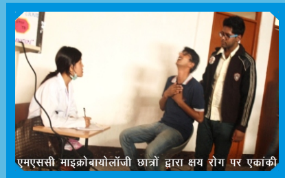
एमएससी माइक्रोबायोलॉजी छात्रों द्वारा क्षय रोग पर एकांकी

24 मार्च, 2015 को सूक्ष्म जीव विज्ञान विभाग, जीवन विज्ञान विद्यापीठ, सिक्किम विश्वविद्यालय द्वारा नए विज्ञान भवन, तादोंग, गंगटोक में विश्व क्षय रोग दिवस के अवसर पर, तपेदिक पर एक जागरूकता कार्यक्रम आयोजित किया गया। इस कार्यक्रम का मुख्य उद्देश्य तपेदिक के कारणों, संचरण के तरीके, रोकथाम और इलाज के बारे में जागरूकता फैलाना था। कार्यक्रम का विषय विश्व