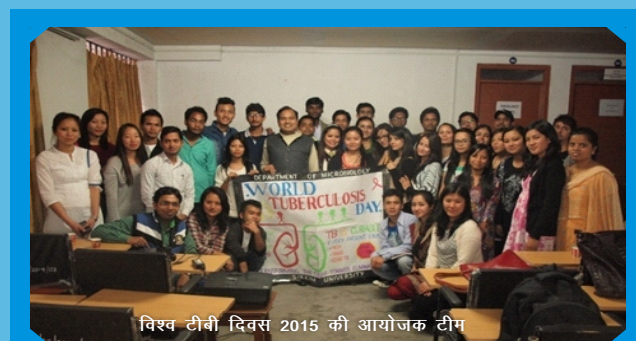
विश्व टीबी दिवस 2015 की आयोजक टीम