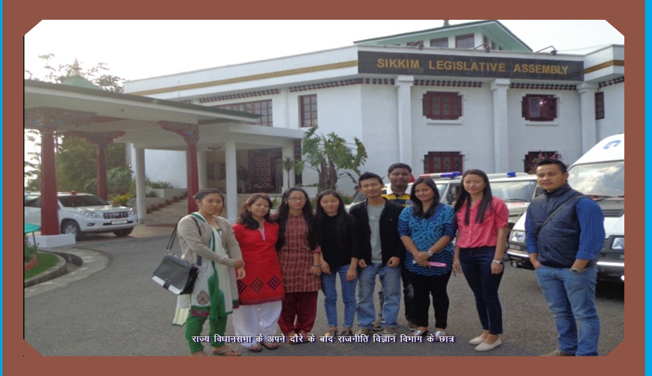
राज्य विधानसभा के अपने दौरे के बाद राजनीति विज्ञान विभाग के छात्र

राजनीति विज्ञान विभाग के छात्रों ने 16-17 मार्च, 2015 के दौरान राज्य विधान सभा के कार्यालय का दौरा किया। उनकी इस यात्रा के दौरान, उन्हें नौवीं सिक्किम विधान सभा के सत्र में भाग लेने का अवसर भी मिला। राजनीति विज्ञान विभाग का मानना है ऐसा करना छात्रों को राज्य के राजनीतिक परिदृश्य को बेहतर तरीके से समझने में सक्षम बनाता है। छात्रों ने कार्रवाई में सरकार की एक झलक और जीवंत संसदीय बहस और विधानसभा में नीति निर्माण को देखा।