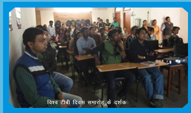
विश्व टीबी दिवस समारोह के दर्शक

क्षय रोग अभी भी उच्च रुग्णता और मृत्यु दर की बीमारी बनी हुई है। वर्तमान परिदृश्य में तपेदिक के प्रसार के मामलों में बहु दवा प्रतिरोध (एमडीआर) मामलों की घटनाओं के साथ वृद्धि हुई है। एमडीआर टीबी के मामले मुख्य रूप से तपेदिक के लिए दवा (डॉट्स) के अधूरे कोर्स की वजह से उत्पन्न होते हैं। इस प्रकार के जागरूकता कार्यक्रम के इस रोग से जुड़ी जानकारी और संबंधित खतरे का संदेश प्रसारित करने और इसकी रोकथाम के उपायों और नियंत्रण में मदद करते हैं। इस कार्यक्रम के उद्देश्यों में से छात्रों को इस तरह के कार्यक्रमों में भाग लेने के लिए शामिल करने के लिए जो कि न सिर्फ अपने ज्ञान को बढ़ाने, बल्कि साथ ही अपने संचार कौशल और इवेंट मैनेजमेंट को विकसित